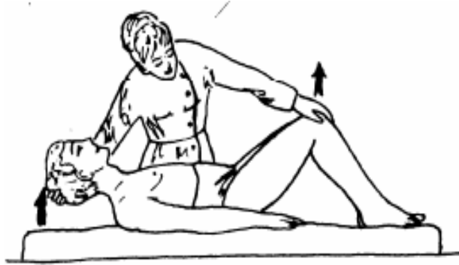
Figure 3 : signe de Bruzinski

Le signe de Kernig : met en évidence une contracture des membres inférieurs :