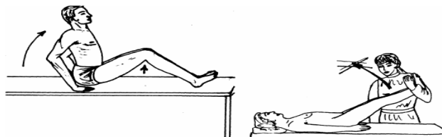
Figure 4 : Signe de Kernig

La constatation d'un syndrome méningé doit conduire à faire une ponction lombaire qui permettra de confirmer l'atteinte méningée et sa cause précise en étudiant le liquide céphalo-rachidien.