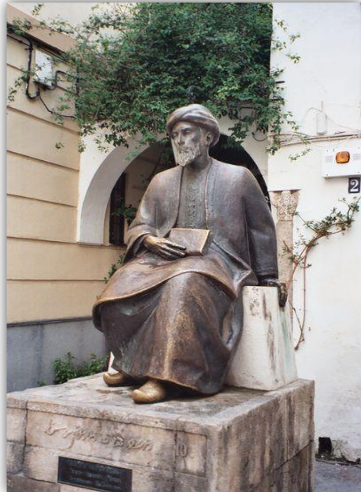
La prière de Maïmonide XII e siècle ( Cordou - Al-Andalus)