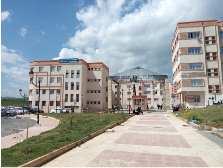
مدخل معهد التكنولوجيا

الطالب في معهد التكنولوجيا مجبر على إجراء